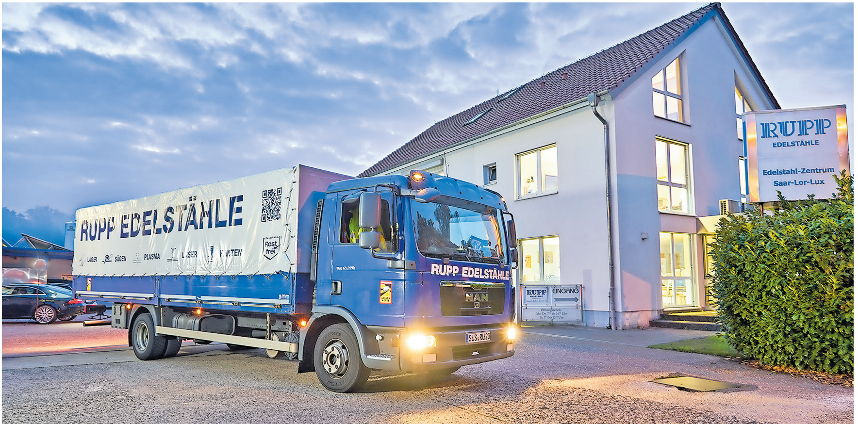
Der eigene Fuhrpark verlässt das Firmengelände in Ensdorf/Saar bereits im Morgengrauen um die Kunden im SAAR/LOR/LUX-Raum zu beliefern.