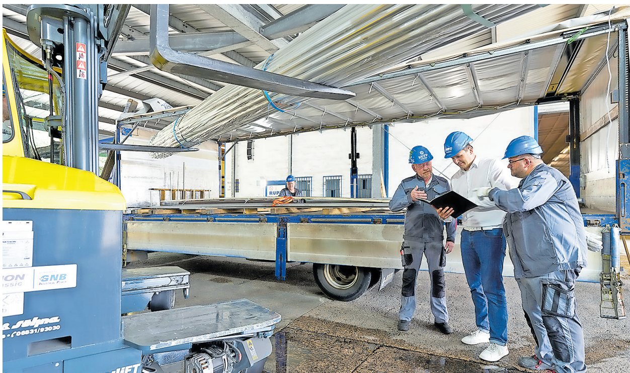
Mit den neuen Flurförderfahrzeugen und technischen Hilfsmitteln wird die Qualitätssicherung und die innerbetrieblichen Verladungsabläufe kontinuierlich weiterentwickelt.