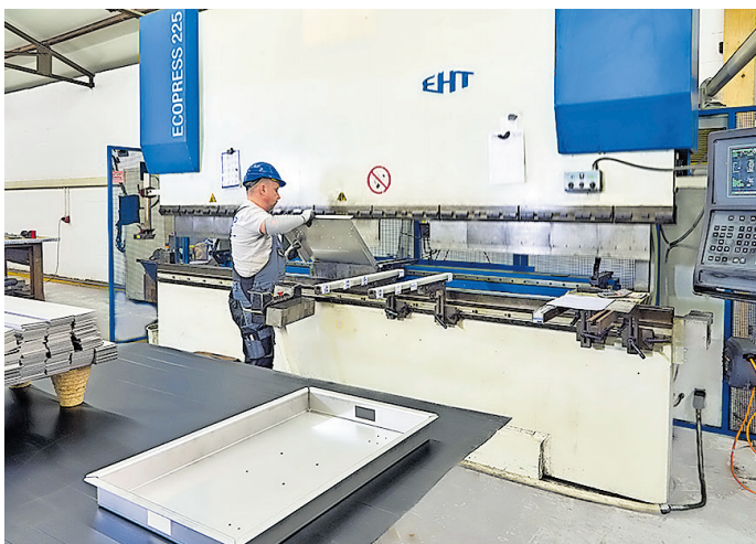
Gelaserte Blechzuschnitte können bis zu einer Länge von 4m in der hauseigenen Blechbearbeitung in fast jede erdenkliche Form gebracht werden.

Natürlich können Sie sich auch auf der Homepage des Unternehmens (siehe Kontaktdaten unten) über das umfangreiche Lieferprogramm